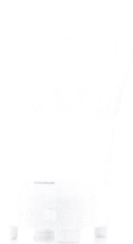
Frapieră cu led și boxă

*Imaginile premiilor sunt cu titlu informativ