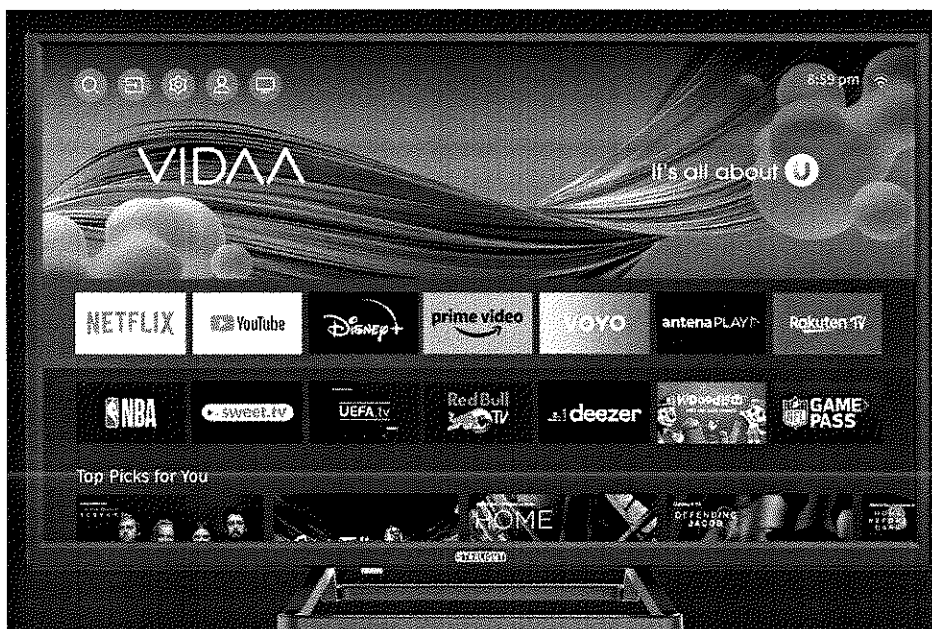
Smart LED TV 32" Star-Light 32DM6600

*Imaginile premiilor sunt cu titlu informativ