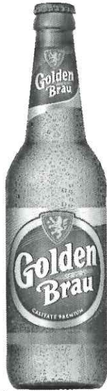
Sticla Golden Brau 0.5L