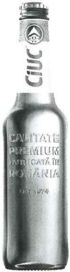
Sticla Ciuc 0.5L