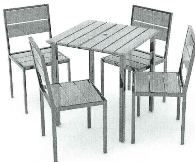
Seturi de mobilier - masa și 4 scaune din lemn

*Imaginile premiilor sunt cu titlu informativ