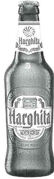
Sticla Harghita 0.5L