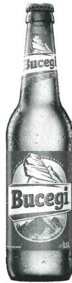
Sticla Bucegi 0.5L