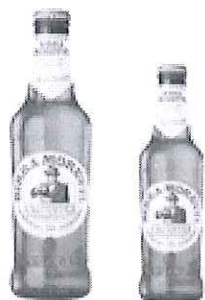
Sticla de bere Birra Moretti 0.5/0.33l