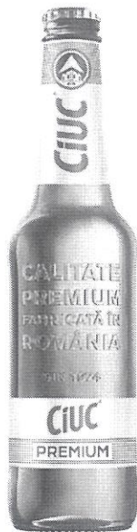
Sticla 0.5 L