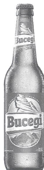
Sticla 0.5 L