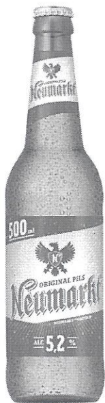
Sticla 0.5 L