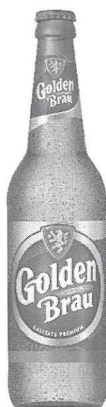
Sticla 0.5 L