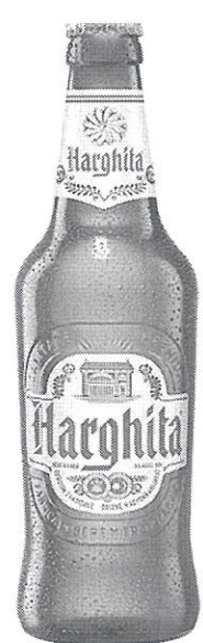
Sticla 0.5 L