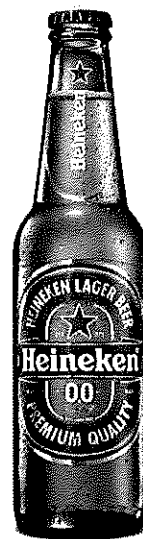
Heineken 0.0% sticla 0.33l