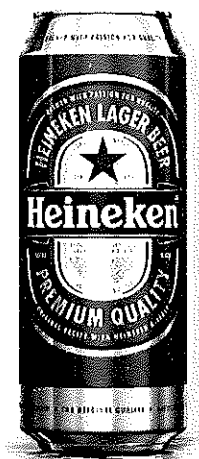
Heineken doza 0.5l