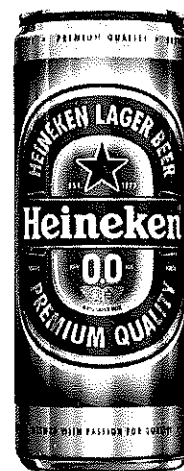
Heineken 0.0% doza 0.5l