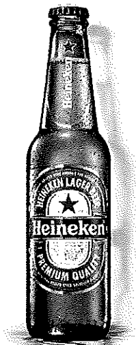
Heineken sticla 0.33l

Anexa nr. 2 Imagine Produse Participante