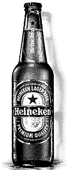
Heineken sticla 0.4l