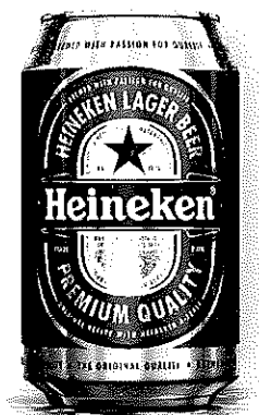
Heineken doza 0.33l