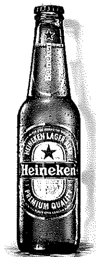
Heineken sticla 0.33l