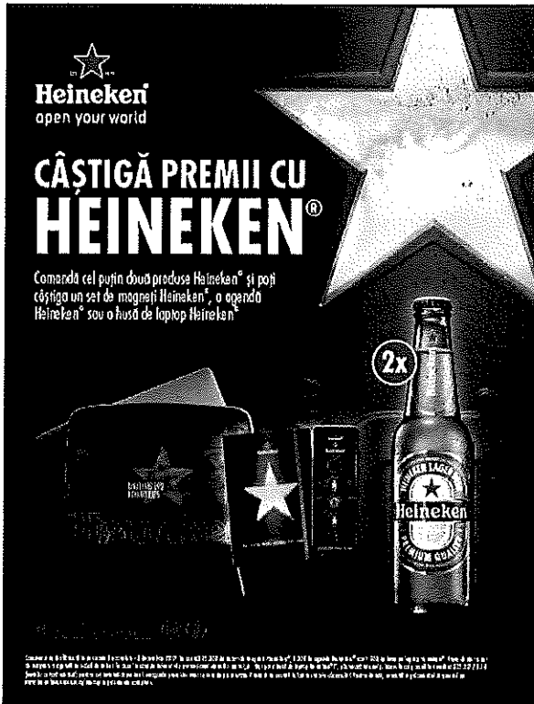
Table tent carton