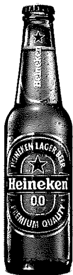
Heineken 0.0% sticla 0.33l