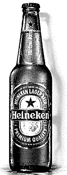
Heineken sticla 0.4l