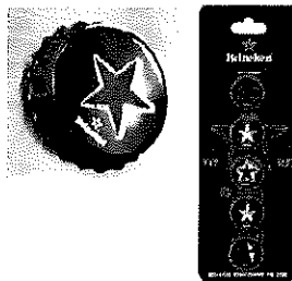
set magneti frigider inscriptionate Heineken®