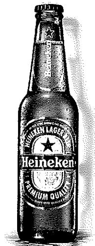
Heineken sticla 0.33l