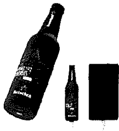
Baterie portabila Heineken®