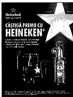
Table tent carton