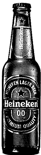
Heineken 0.0% sticla 0.33l