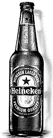
Heineken sticla 0.4l