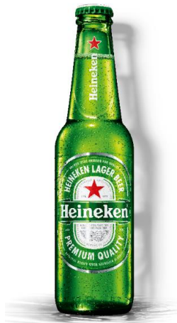
Heineken sticla 0.33l