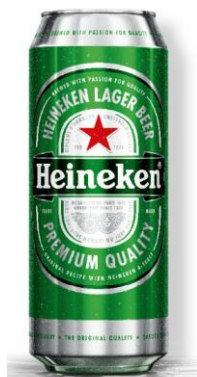
Heineken doza 0.5l